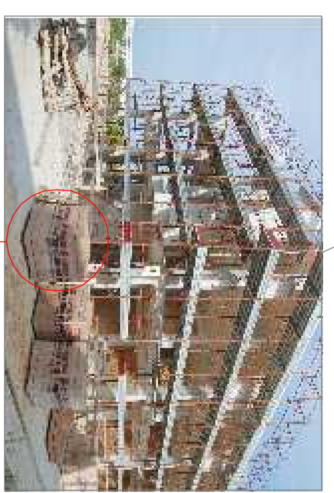
MODULO FV MM4020 - 24,5 x 40 x 20 MODULO FANTINI - SPANALICO