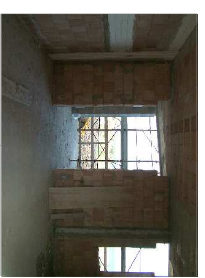
Muratura di tempio realizzata mediante MODULO FV MM4020 - 24,5 x 40 x 20