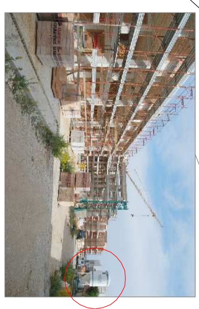
Muro d'altipietamento FASDA BORTOLO