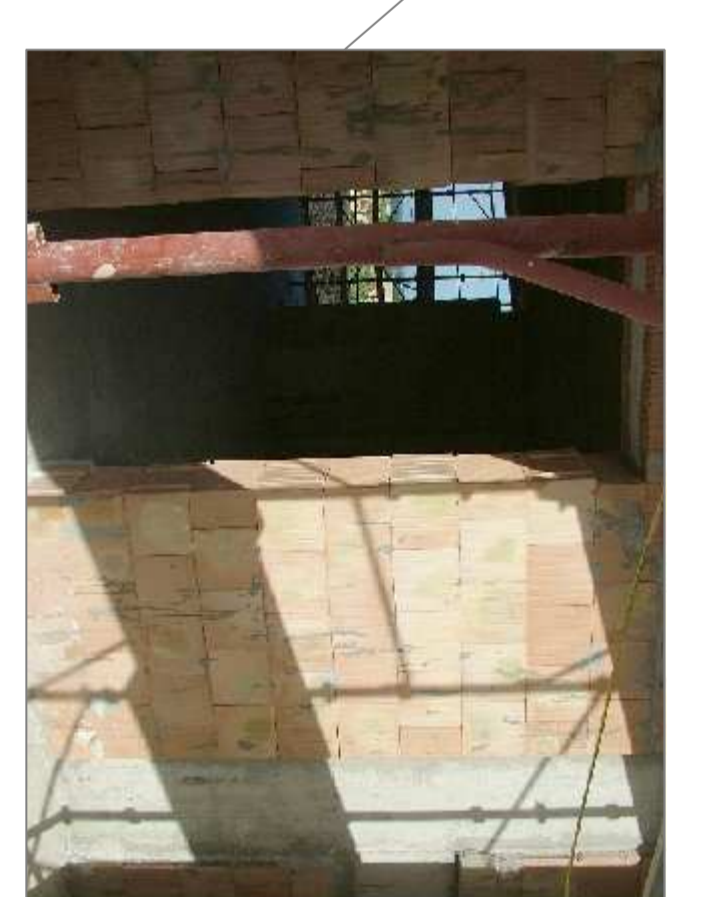
Muratura di tempio realizzata mediante MODULO FV MM4020 - 24,5 x 40 x 20