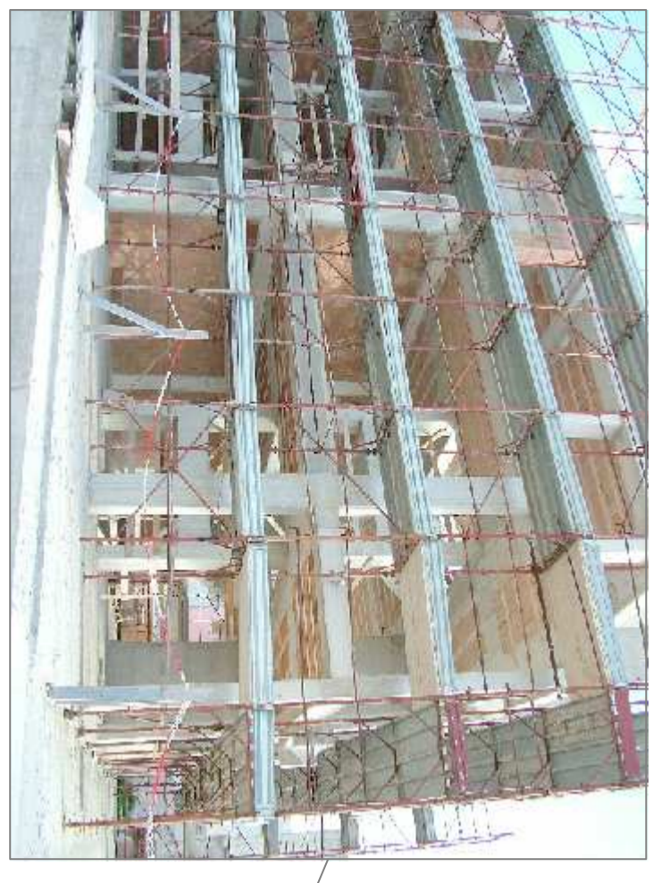
Muratura di tempio realizzata mediante MODULO FV MM4020 - 24,5 x 40 x 20