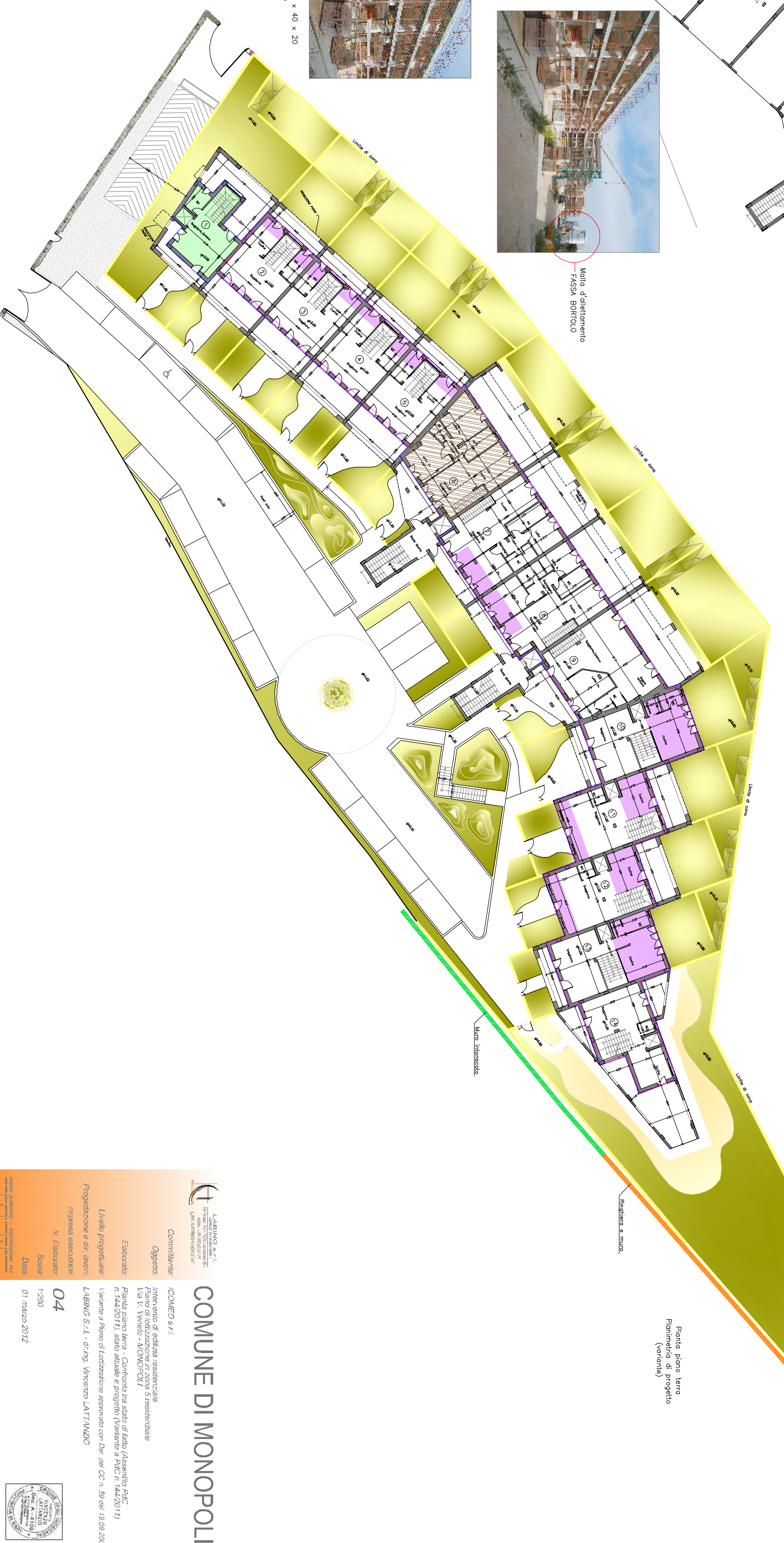
Pianta piano terra Pianimetria di progetto (veronice)