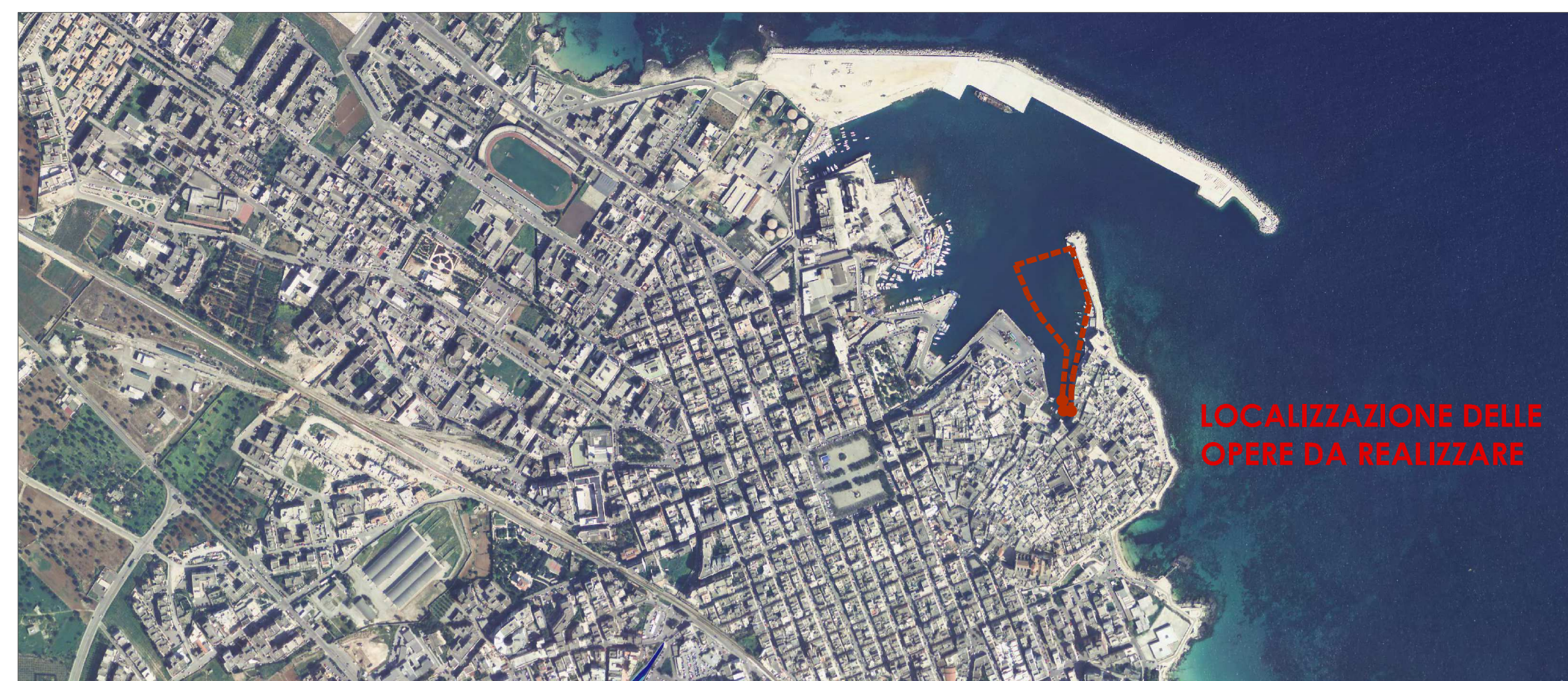
STRALCIO PAI - Pericolosità Idraulica SCALA 1:10000