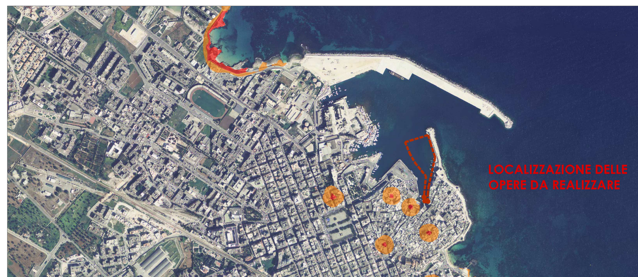
STRALCIO PAI - Carta del Rischio SCALA 1:10000