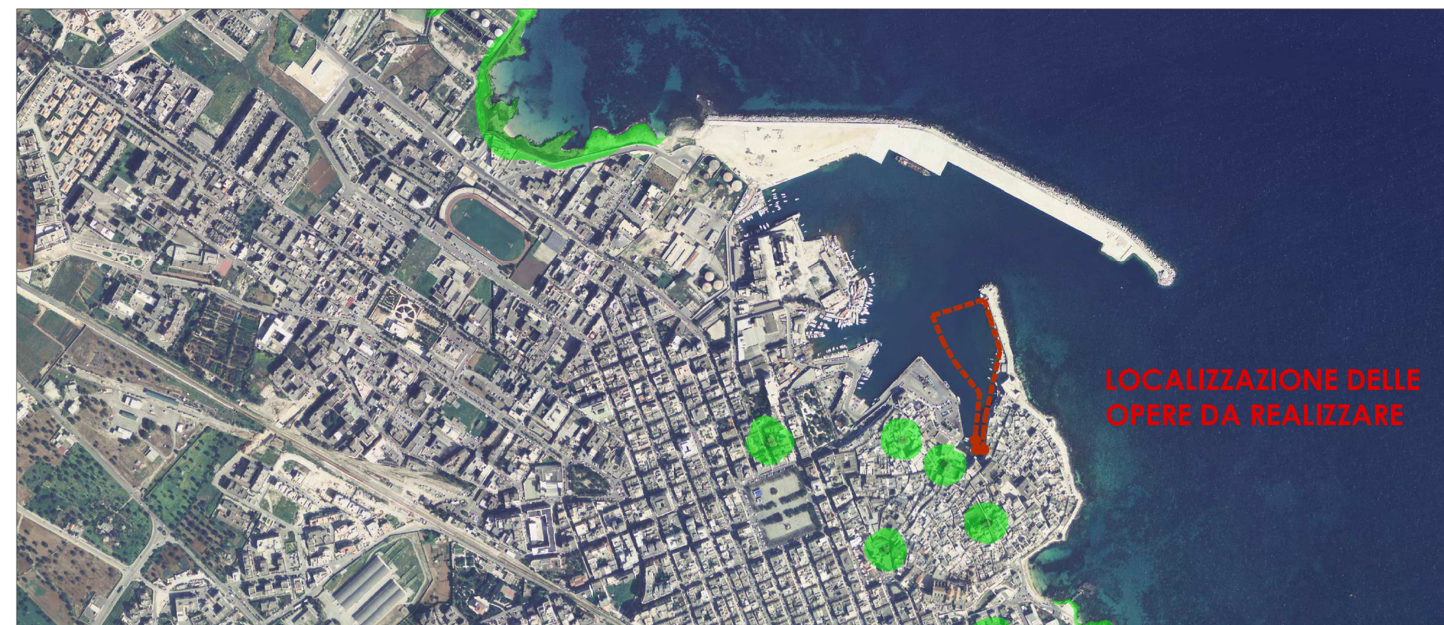
STRALCIO PAI - Pericolosità Geomorfológica SCALA 1:10000