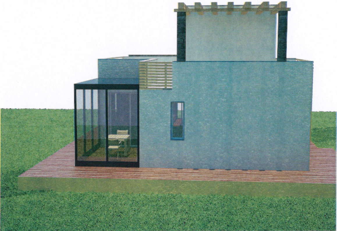
Vista numero 4