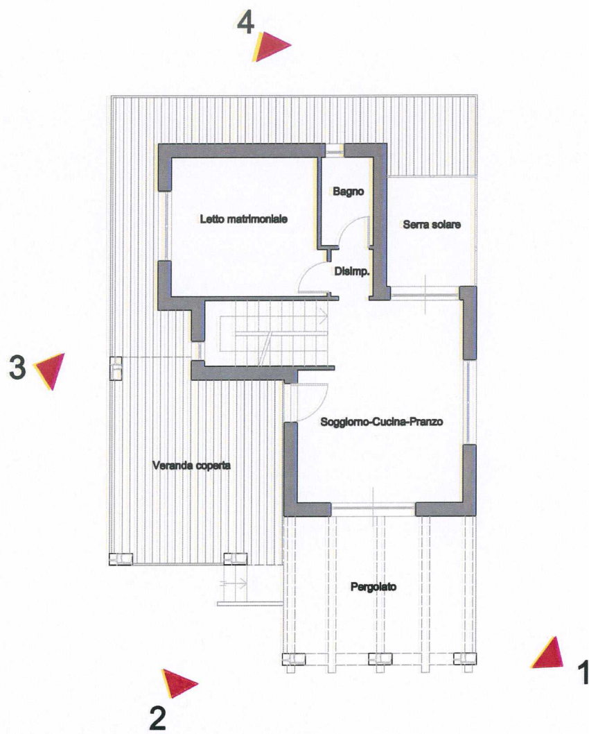
Pianta piano terra tipologia "A" con punti di vista