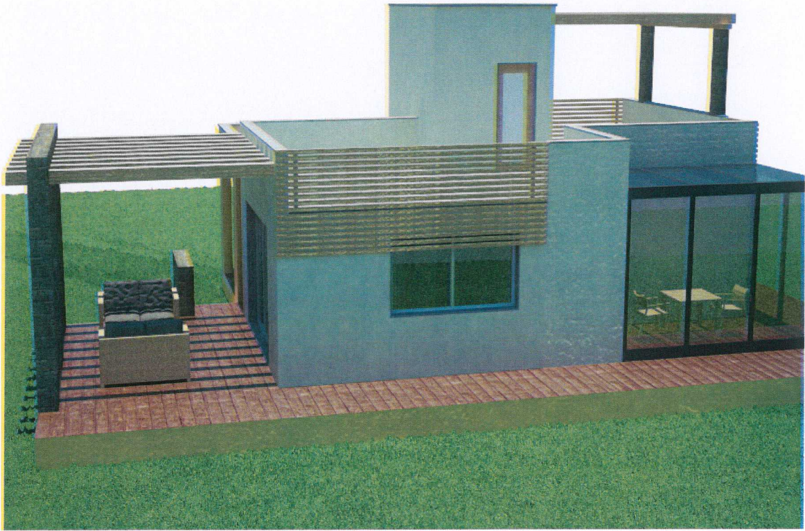
Vista numero 1