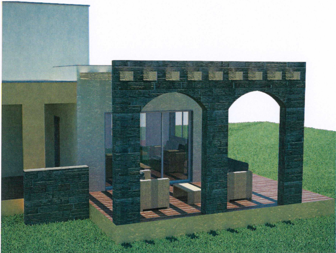
Vista numero 2