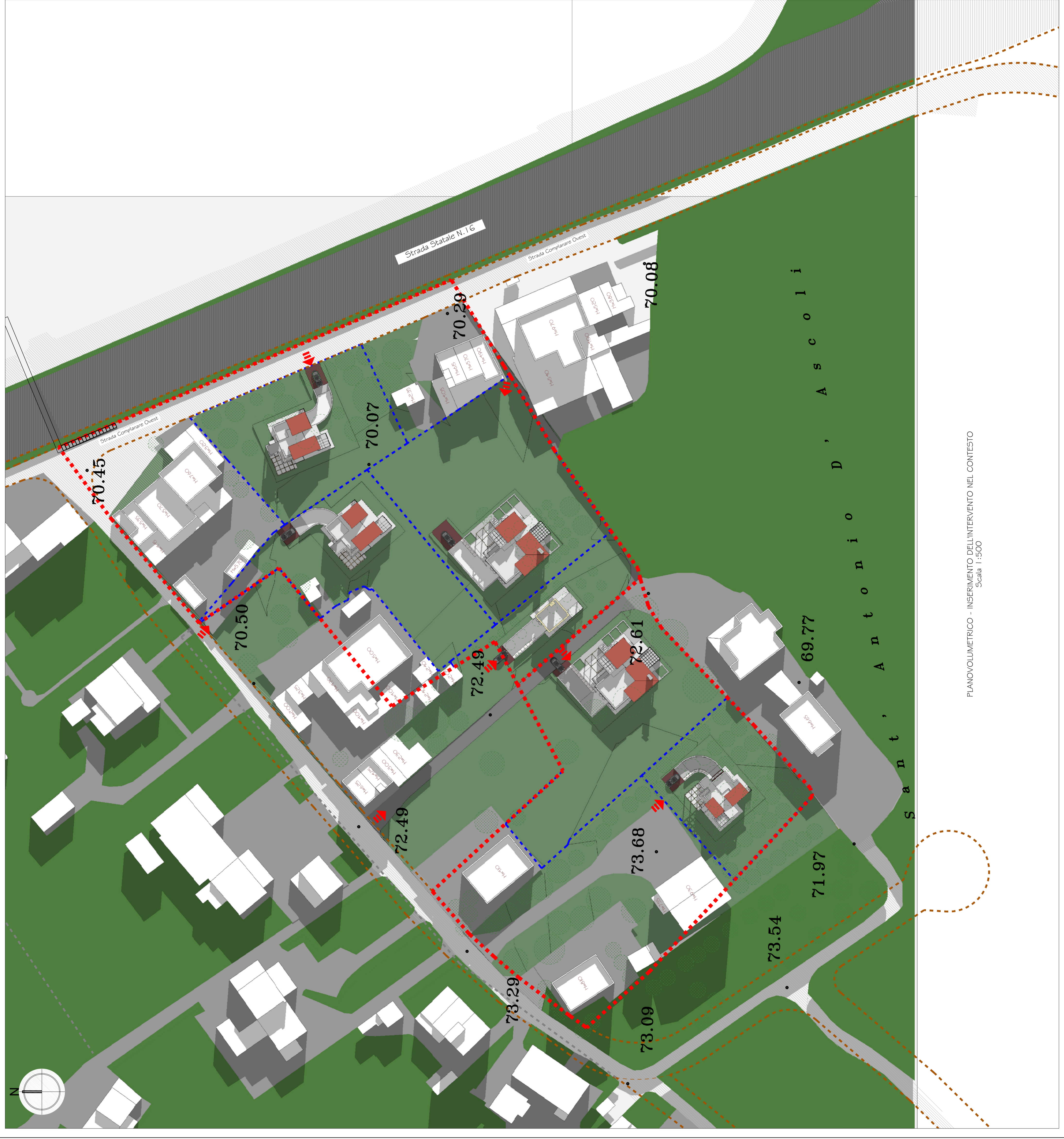
PLANO VOLUMETRICO - INSERIMENTO DELL'INTERVENTO NEL CONTESTO Scala 1:500