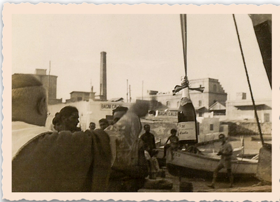
(F) La traditionnelle cérémonie de lancement (3 août 1945)