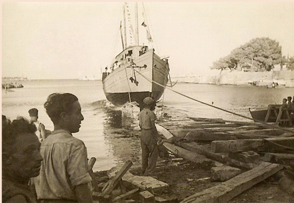
(F) Le Sirius se glisse dans la Méditerranée (3 août 1945) (E) The Sirius slips into the Mediterranean (3 August 1945) (I) Il Sirius scivola nel Mediterraneo (3 agosto 1945)