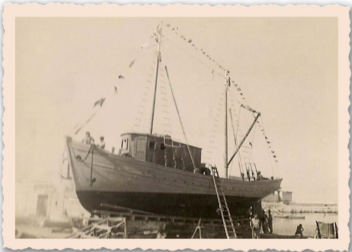
(F) Le Sirius prêt pour le lancement (3 août 1945)